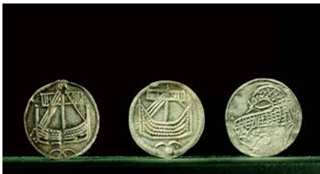
Mynt från 800-talet som har hittats i Birka. Mynten kommer förmodligen från Hedeby, Danmark.

Vikingar från östra Sverige och Finland reste oftast österut. Med sina skepp tog de sig fram på de ryska floderna. Ibland gick de iland och fortsatte till fots.