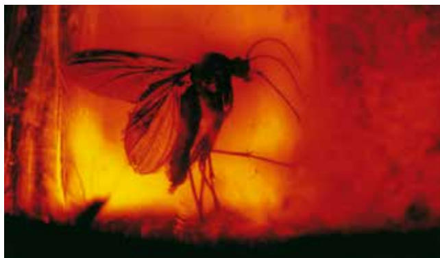
Bärnsten bildas av kåda från träd. Inuti den här bärnstenen finns en flera miljoner år gammal insekt.

Under medeltiden flyttade människor från andra områden, bland annat från Tyskland till Norden. De tog med sig sina språk, traditioner och kunskaper.