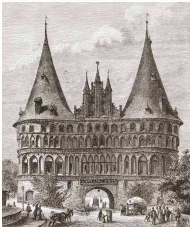
Den tyska staden Lübeck ingick Hansan. Bild på Holstentor, en stadspört, i Lübeck byggd år 1478.

skeppen med exempelvis sill, kött, järn och sten som skulle säljas på andra platser.