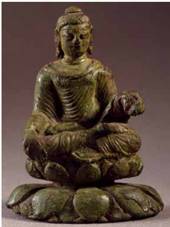
En indisk buddhastaty från 500 e.v.t. Fynd från Helgö i Mälaren.

När människor flyttar till nya platser, till exempel till ett annat land kallas det migration. Eftersom det oftast redan bor andra människor på platsen dit någon flyttar sker ett möte mellan människor. När människor med olika kultur, det vill säga språk, religion och/eller sätt att leva möts sker ett möte mellan olika kulturer. Det kallas för kulturmöte.