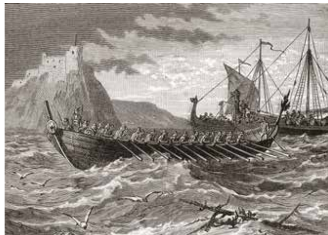
Vikingaskeppen tog sig fram med både åror och segel.

Genom handel med andra länder fick människorna i Norden tillgång till varor som de inte hade haft