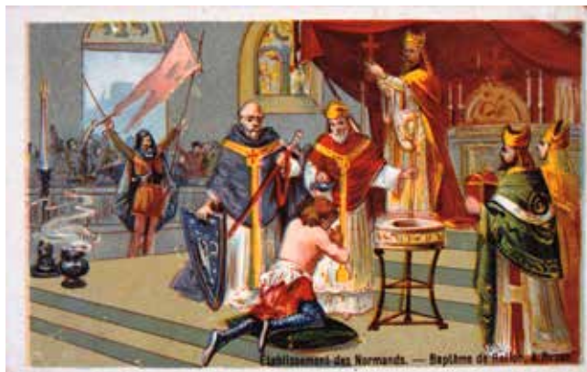
Vikingahövdingen Rollo utvandrade till norra Frankrike i början av 900-talet. Målningen visar hur Rollo döps.

De flesta vikingarna som reste i Europa bedrev handel, men några vikingar stal och plundrade.