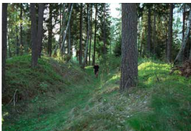
Spår av en medeltida väg från medeltiden. Tidaholm, Västergötland.

Varorna som kom till Sverige såldes sedan vidare av handelsmän som tog sig fram på de smala vägarna som fanns mellan städerna och byarna. De hade ibland med sig hästar som bar deras varor, till