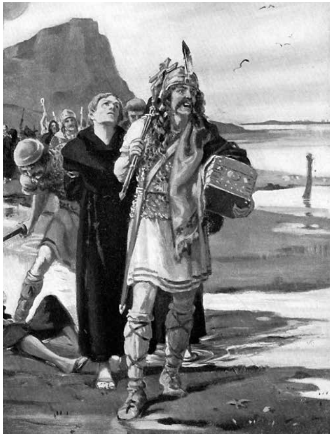
Vikingar anföll och plundrade klostret på Lindisfarne, Brittiska öarna, år 793.

Människorna som bodde i de områden dit vikingarna kom var rädda. De visste att vikingarna var våldsamma och farliga. Vikingarna var duktiga