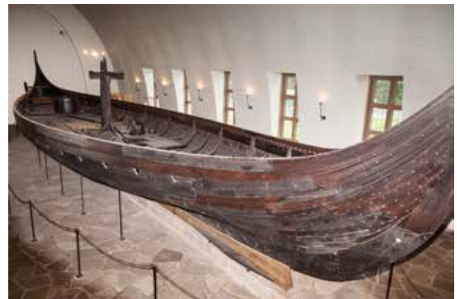
Skepp från vikingatiden. Fynd från Gokstad, Norge.

Vikingen är ofta en symbol för styrka och mod. I filmer och på bilder ser vikingarna ofta ut att vara stora, starka och farliga. Alla vikingar såg förstås inte ut så.