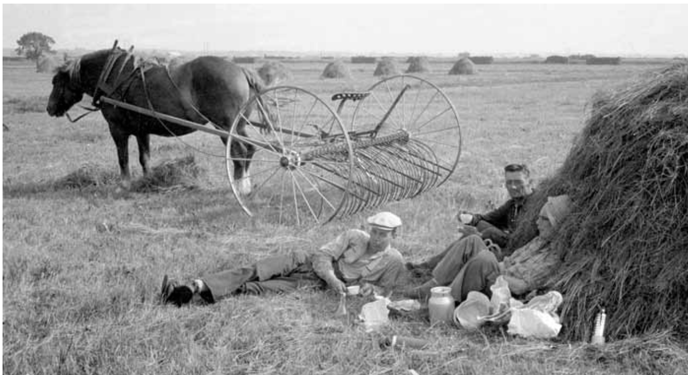
Fikarast vid arbete på ett fält utanför Mariestad, 1950-tal.