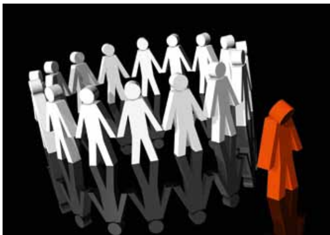
Grupper har både för- och nackdelar.

Det kan vara positivt att tillhöra en grupp då det gör livet enklare. Vi vet till exempel hur vi ska bete oss i olika situationer, vilket skapar trygghet. Vi känner oss accepterade och känner att vi betyder något.