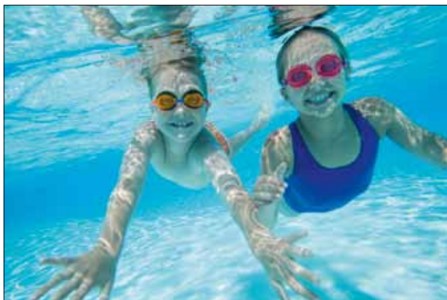
Alla barn i Sverige ska få chansen att lära sig simma.

Du som läser det här har kanske kommit från ett annat land. Vad kan du göra för att bli bättre integrerad? Det