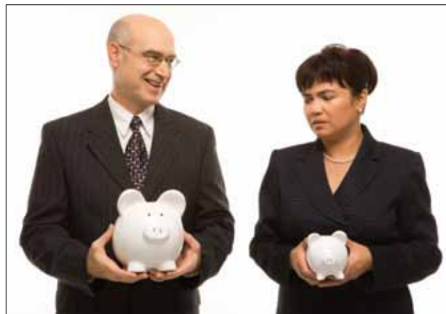
En man tjänar oftast mer än en kvinna med lika arbetsuppgifter. Det är diskriminering på grund av kön.

Antalet anmälningar till DO ökar. Anmälningar av etnisk diskriminering är vanligast. Många upplever att de till exempel inte har fått ett arbete på grund av sitt