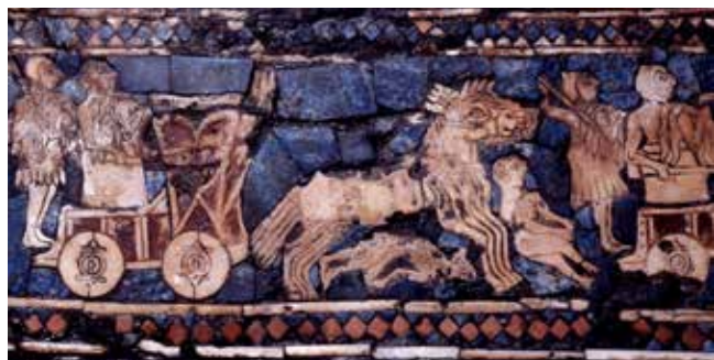
Sumerer åker vagn över dödade fiender. Mesopotamien 2500 f.v.t.

I Tyskland utvecklades den första bärbara klockan