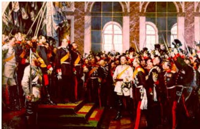
Tyska kejsardömet utropas i spegelsalen i Versailles utanför Paris 1871.

Skottland, Estland och Kurdistan kan också ses som länder. Begreppet land kan syfta på en stat, men också endast på ett geografiskt område. Est-