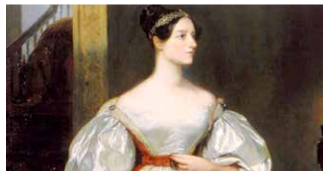
Ada Lovelace, en brittisk matematiker, anses vara en föregångare inom datorprogrammering.

Ada Lovelace var en föregångare inom datorprogrammering. Åren 1842-1843 var hon en av de första att skriva en algoritm som kunde styra en mekanisk dator. Den första programstyrda datorn (1941), internet (1969), epost (1971), GPS (1970-talet) och webben som massmedium (1993) är några av de stora framstegen under 1900-talet.