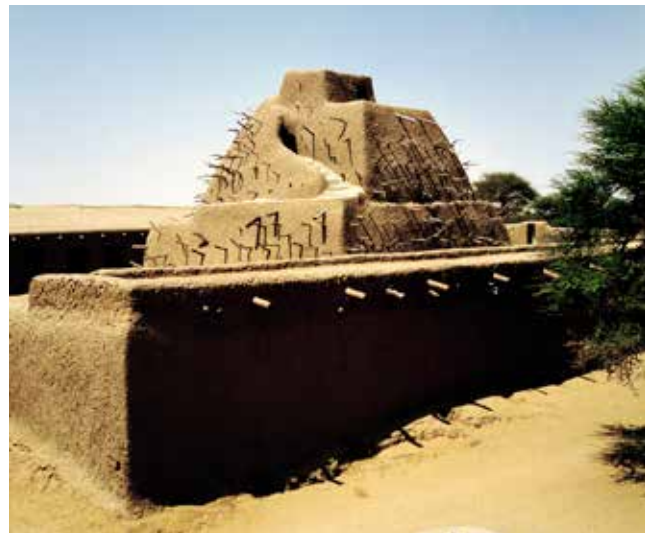
Gravplats från 1495 för Songhairikets förste kejsare Askia Mohammed.

Stater använde sig mycket av religionen för att legitimera, det vill säga skapa acceptans för, staten och ledarens makt. Kungarna, kejsarna eller kali-