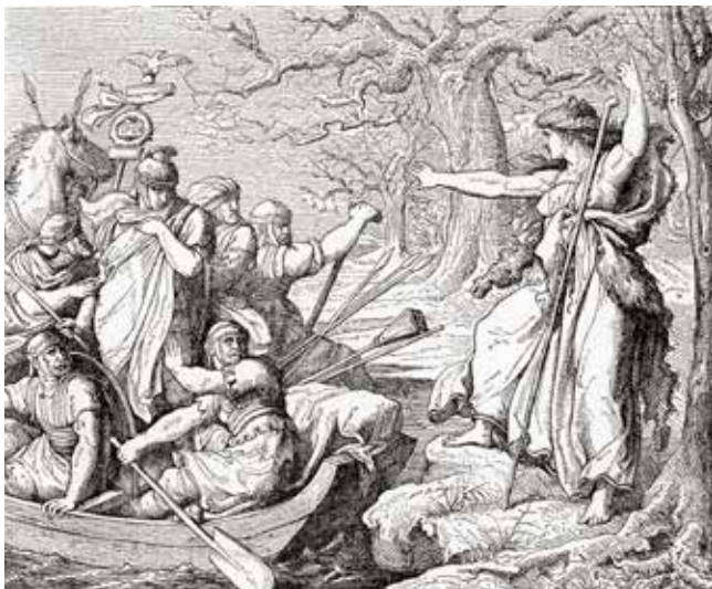
Veleda, prästinna i den germanska stammen bruktererna i nordvästra Tyskland, ledde ett uppror mot romerska riket 69 e.v.t.

I stamsamhället kunde tusentals människor ingå. De som ingick i stammen var släkt med varandra. Eftersom det blev ett överskott av mat hade stamsamhället råd med en särskild grupp av soldater som fanns i ledarens närhet när stammen var i krig.