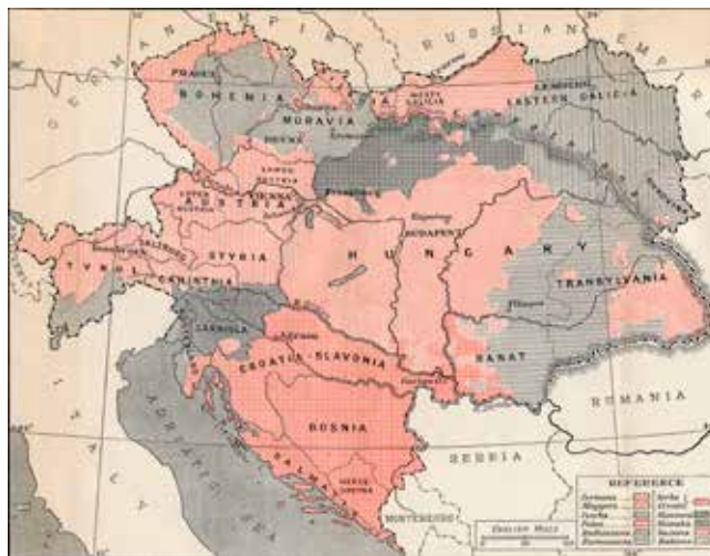
Tyskar, ungrare, tjecker, polacker, rusiner, rumäner, serber, kroater, slovener, slovakar, siebenbürgensachsare och italienare i Österrike-Ungern 1878.

För det andra kan begreppet folk syfta på en etnisk grupp. Språket är ofta den viktigaste delen i den här nationalismen. Den kallas 'etnisk' (eller kulturell) nationalism. Till en början var den etniska nationalismen också frihetlig. Den ledde till att folken i Östeuropa gjorde sig fria och självständiga från de habsburgska (Österrike-Ungern) och osmanska (Turkiet) imperierna. Det första landet som blev självständigt från det osmanska imperiet var Grekland (1830). De två imperierna upplöstes helt efter första världskriget 1918. Det habsburgska kejsardömet splittrades då upp i de nya staterna Jugoslavien, Tjeckoslovakien, Ungern och Österrike. Osmanska rikets områden i Mellanöstern kom under brittisk och fransk kontroll (Irak, Syrien, Libanon och Palestina). Nationalismen fungerade här splittrande för de befintliga imperierna.