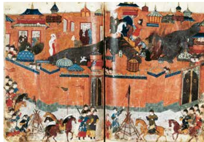
Mongolernas belägring av Bagdad 1258.