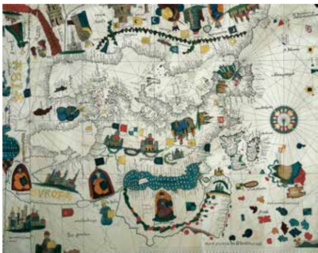
Karta över Europa från tidigt 1500-tal.

Nationalismen uppstod i samband med och efter de amerikanska och franska revolutionerna 1776 respektive 1789. Enligt nationalismens idé är det