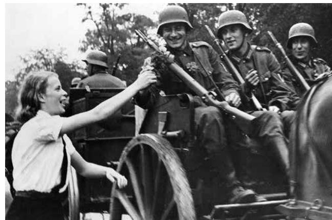
Tysk kvinna hyllar de tyska soldaterna på en militärparad i Berlin 1940 efter invasionen av Frankrike.

Efter de jugoslaviska krigen på 1990-talet bildades sex nya stater (Bosnien, Kroatien, Makedonien, Montenegro, Serbien och Slovenien). Den nybildade staten Sydsudan blev FN:s 193:e medlemsstat 2011.