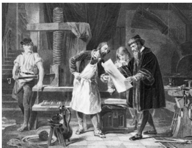
Gutenbergs uppfinning av tryckpressen på 1400-talet effektiviserade boktillverkningen.

Med en kikare som förstorade 33 gånger kunde