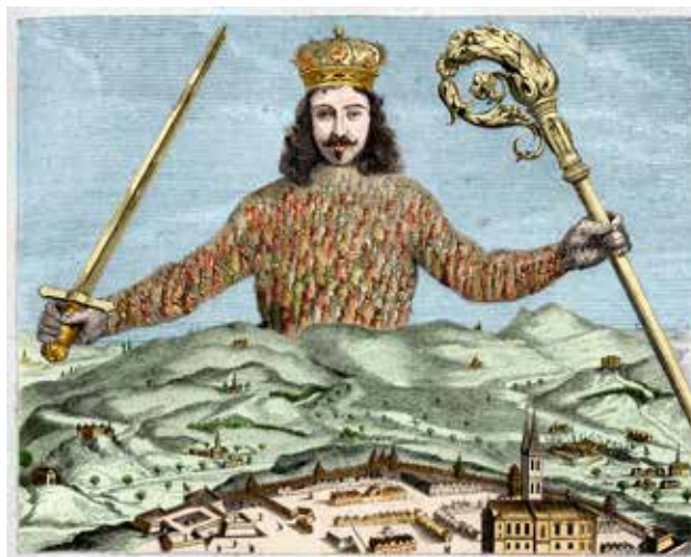
Bild från Thomas Hobbes bok Leviathan (1651). Människans liv innan staten fanns var enligt Hobbes "ensamt, uselt, vidrigt, djuriskt och kort".

Statsbildning är den process som sker när stater bildas. En stat kännetecknas av en stark centralmakt, till exempel en diktatorisk kejsare eller ett demokratiskt folkvalt parlament, som har