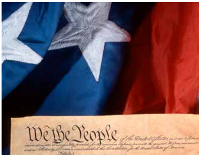
Statsnationalism i USA.

I samband med Napoleonkrigen (1803-1815)